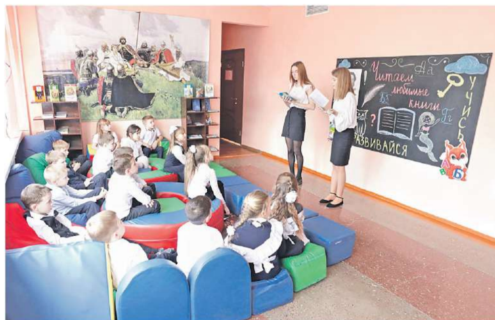
В рамках проекта «Дети — детям» старшеклассники читают книги ученикам начальной школы (Ровеньская школа с углублённым изучением отдельных предметов)