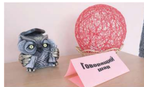
«Говорящий шар» в школе с УИОП. Ученики бросают в него свои отзывы и пожелания