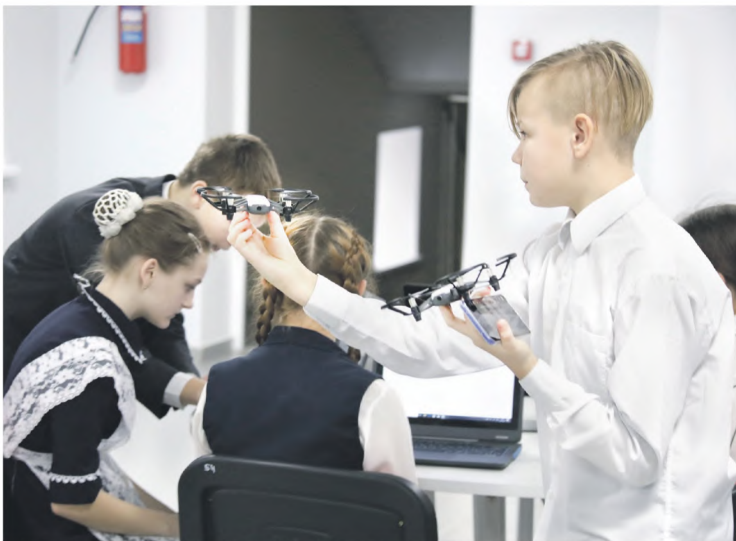
Квадрокоптерами сейчас даже в сельской школе никого не удивишь. С ними легко справляются в «Точке роста» Ровеньской школы № 2

На занятии внеурочной деятельности у младших школьников «Начинаем изучать английский язык» нам показали, как можно использовать флеш-карты (не компьютерные флешки, а карточки