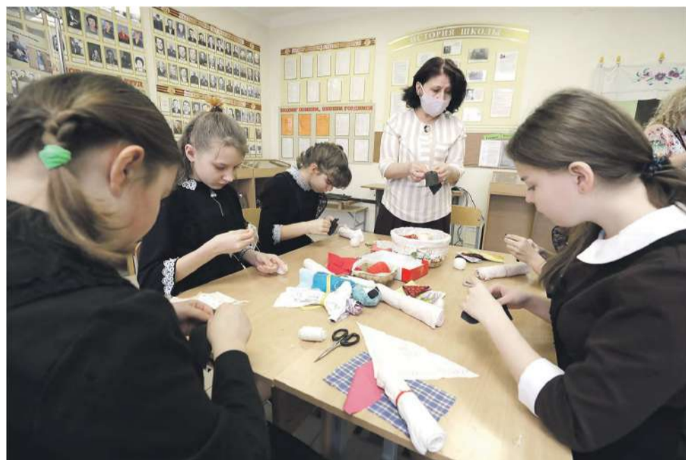
В рамках программы «Народная и авторская кукла» ученицы Новоалександровской школы учатся шить куклу-столбушку