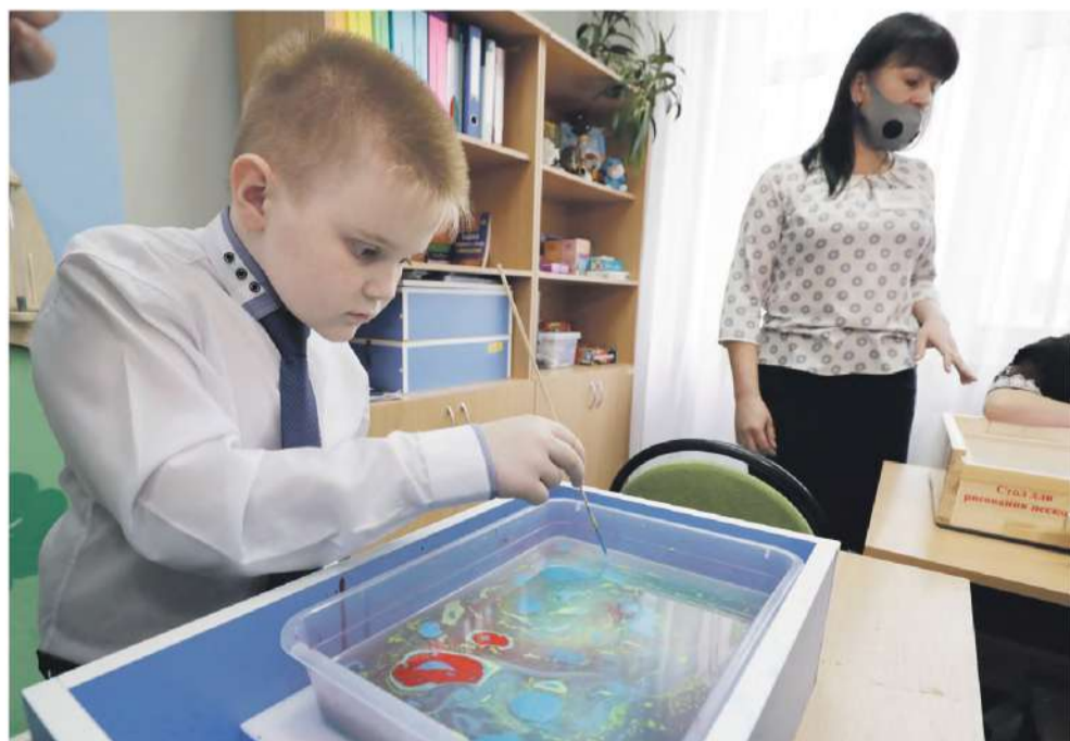
Занятие по акваанимации в Новоалександровской школе

Дальше директор ведёт нас в «деревню Йогуртово». Она расположилась в обычном классе, только вместо учебников и ручек на столе — йогурты, фрукты и другие начинки и добавки.