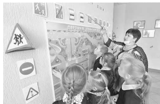
В Клименковской школе Вейделевского района

действию этих мероприятий на конкретного ребёнка сиюминутно, потому что результат, как правило, отдалён во времени, к тому же отсутствуют измерители воспитанности и сформированности навыка поведения на дороге. Но ни одна школа не стоит в стороне от этой работы.