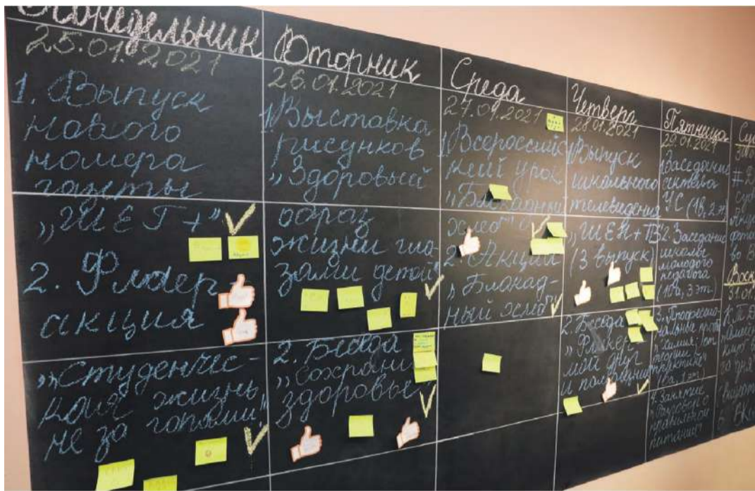
«Говорящая» стена в школе с УИОП