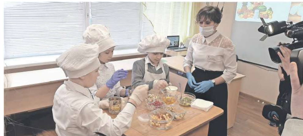
На внеурочке, посвящённой правильному питанию, ученики школы с УИОП готовят вкусные и полезные блюда