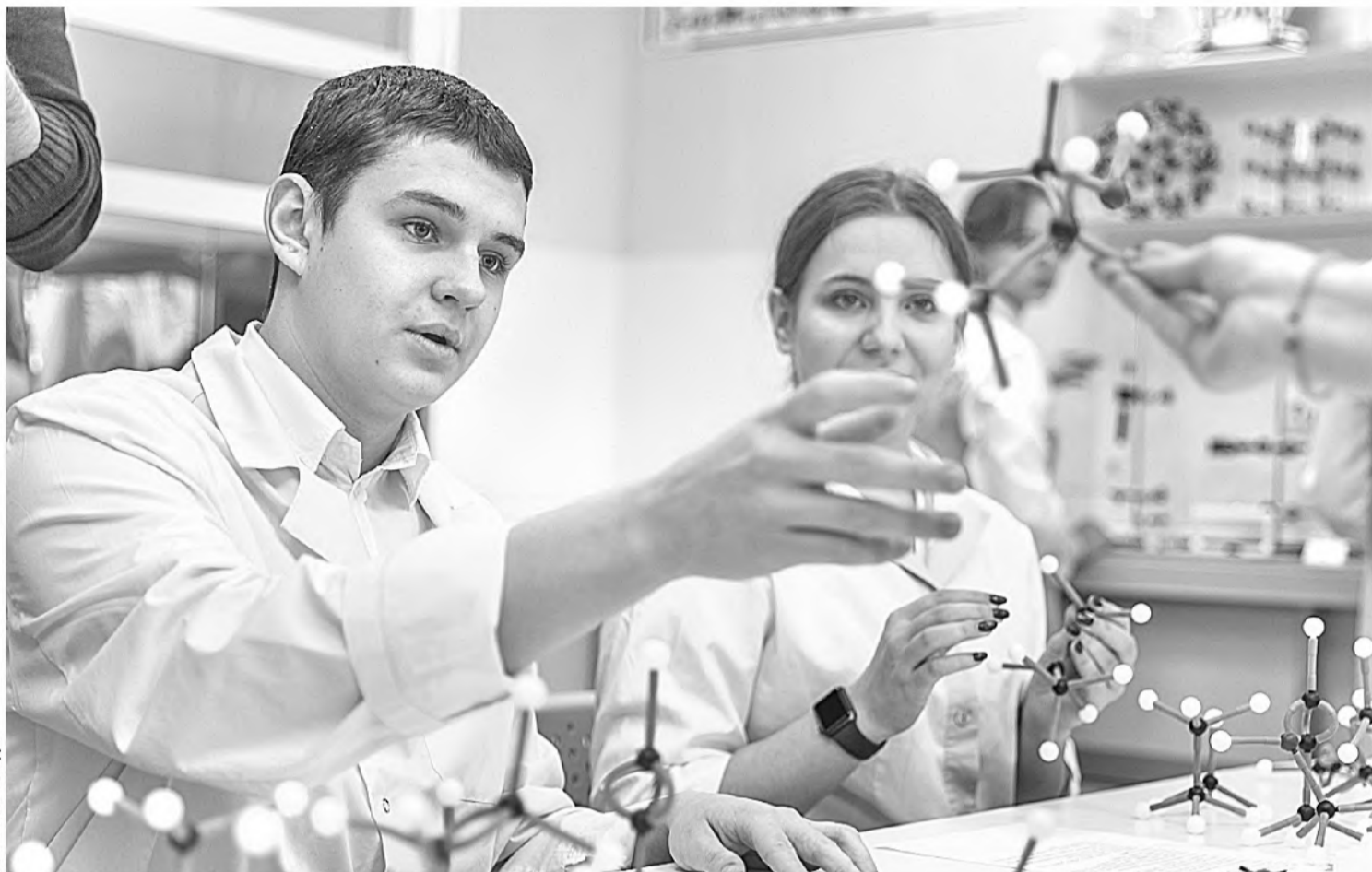
В химической лаборатории Шуховского лицея

В СОЦИАЛЬНЫХ СЕТЯХ ПОЯВЛЯЛОСЬ МНОГО СООБЩЕНИЙ О ТОМ, ЧТО СИТУАЦИЯ С КОРОНАВИРУСОМ — ЭТО ОСНОВАНИЕ ДЛЯ ПЕРЕВОДА ВСЕЙ СИСТЕМЫ ОБРАЗОВАНИЯ В ДИСТАНЦИОННЫЙ ФОРМАТ НА ПОСТОЯННОЙ ОСНОВЕ. УБЕЖДАТЬ НАРОД, ЧТО ТАКИЕ ЗАЯВЛЕНИЯ ОДНОЗНАЧНО БЕСПОЧВЕННЫ, НАМ СУЩЕСТВЕННО ПОМОГАЛ ОПЫТ ШКОЛ РАН, КОТОРЫЕ ПРОДЕМОНСТРИРОВАЛИ, ЧТО ОБРАЗОВАНИЕ — НЕ ТОЛЬКО ПРИОБРЕТЕНИЕ СУММЫ ЗНАНИЙ, НО ЭТО, ПРЕЖДЕ ВСЕГО, СОЦИАЛИЗАЦИЯ РЕБЯТ, ПЕРЕДАЧА ОПЫТА ПОКОЛЕНИЙ, ДУХОВНО-ПРАВСТВЕННЫХ ЦЕННОСТЕЙ, ЧТО ЯВЛЯЕТСЯ НЕВОЗМОЖНЫМ БЕЗ ЛИЧНОСТИ УЧИТЕЛЯ, БЕЗ НЕПОСРЕДСТВЕННОГО ВЗАИМОДЕЙСТВИЯ С УЧИТЕЛЕМ, БЕЗ УЧАСТИЯ РЕБЁНКА В КОЛ-