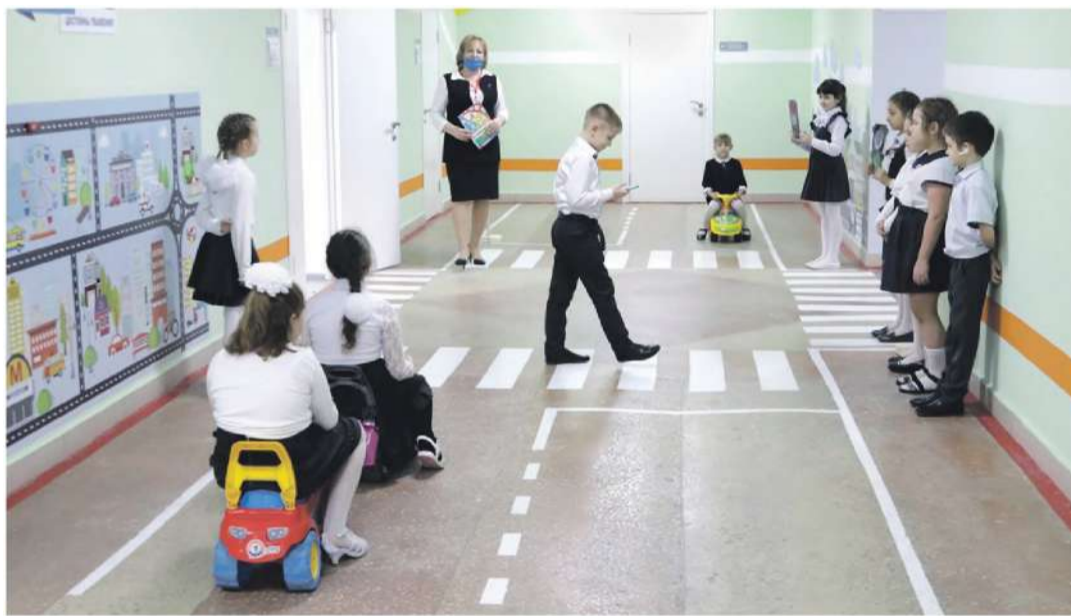
Занятия в образовательной зоне «Правила движения достойны уважения!» в школе № 2

ского творчества. Здесь занимаются и младшие школьники, для которых конструирование роботов — уже привычное дело. Как и для учеников школы с УИОП: в зависимости от возраста детей здесь действует два объединения дополнительного образования — «Робототехника» и «Введение в робототехнику».