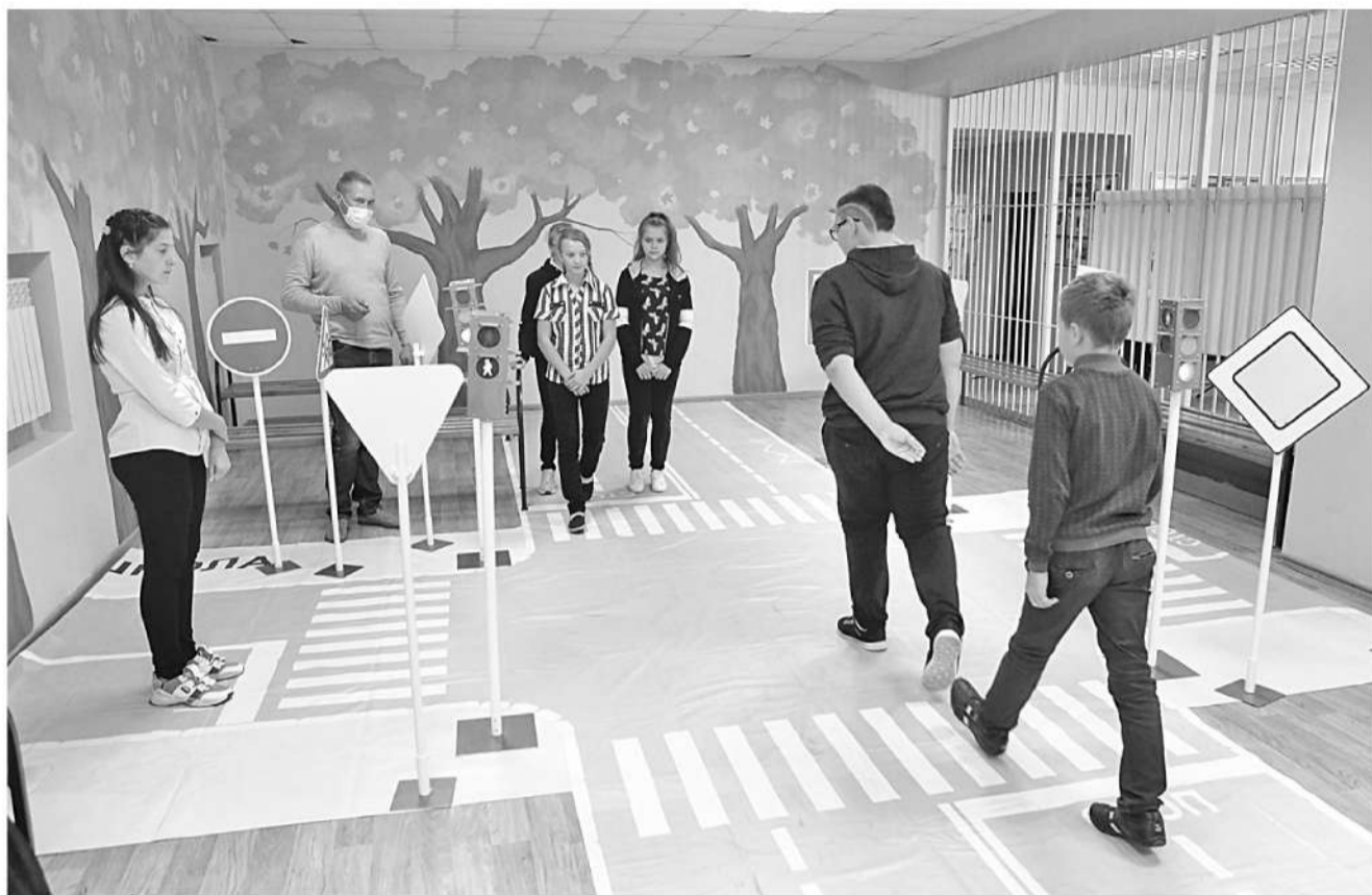
В Курасовской школе Ивнянского района

В наших школах во второй половине дня организованы пятиминутки безопасности перед уходом школьников домой, просмотр видеороликов, выступления агитбригад, проведение интеллектуально-познавательных и сюжетно-ролевых игр, целевых прогулок и экскурсий. Белгородская область принимает участие во всех всероссийских мероприятиях, которые рекомендованы Министерством просвещения Российской Федерации. Мы не можем делать выводы о воспитательном воз-