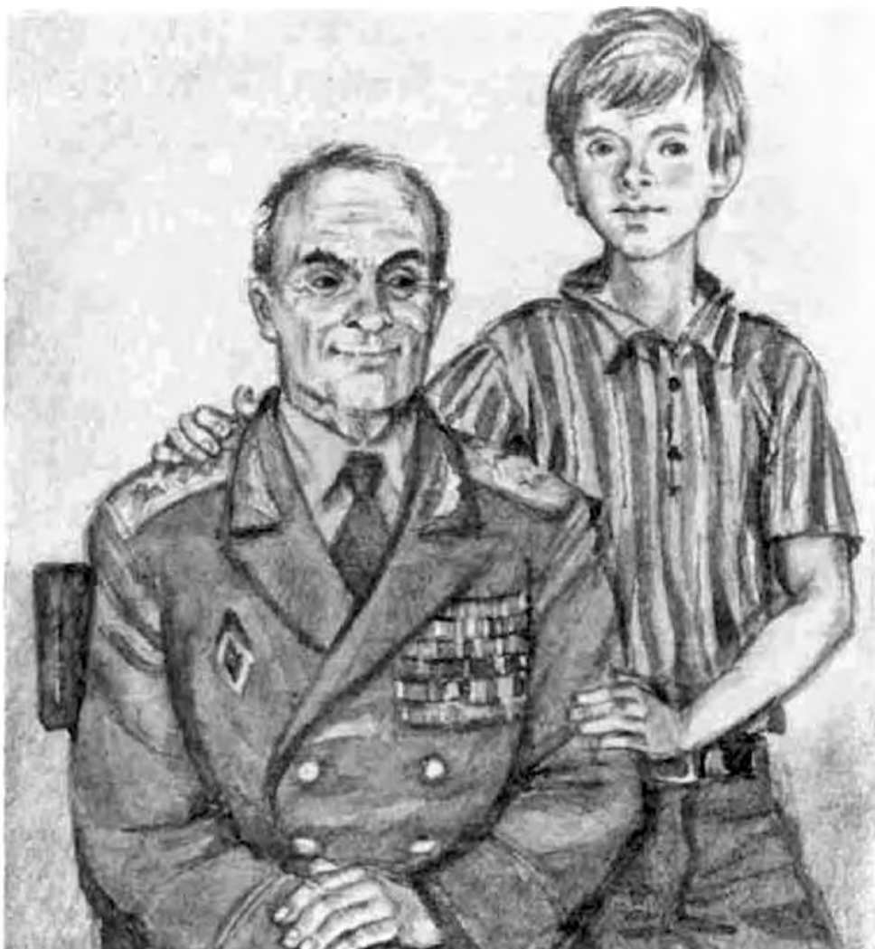
Иллюстрация к повести «Мой генерал» художника Юрия Иванова

ЧИТАТЬ СТАТЬЮ «ИСКАТЬ ДОБРО ВОКРУГ СЕБЯ» О КНИГЕ «НЕЗАБЫТЫЕ ИГРУШКИ»