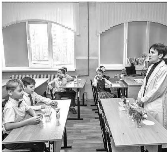
Шуховцы изучают кислотность почвы