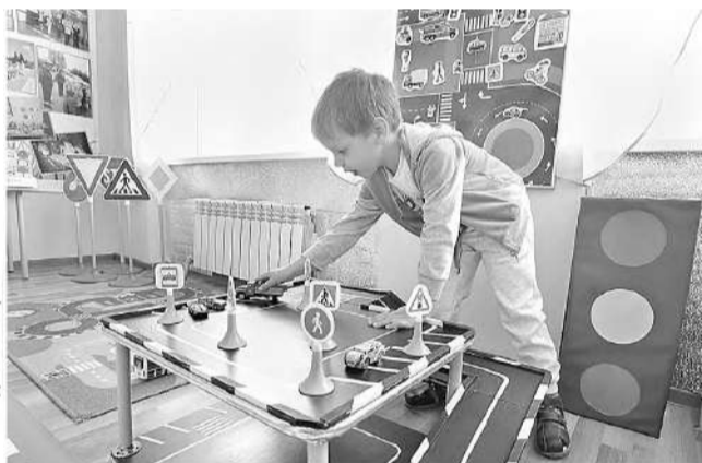
В детском саду «Сказка» пос. Ивня