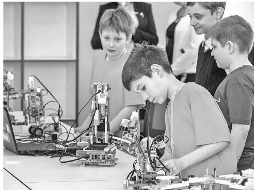
Студия робототехники Шуховского лицея