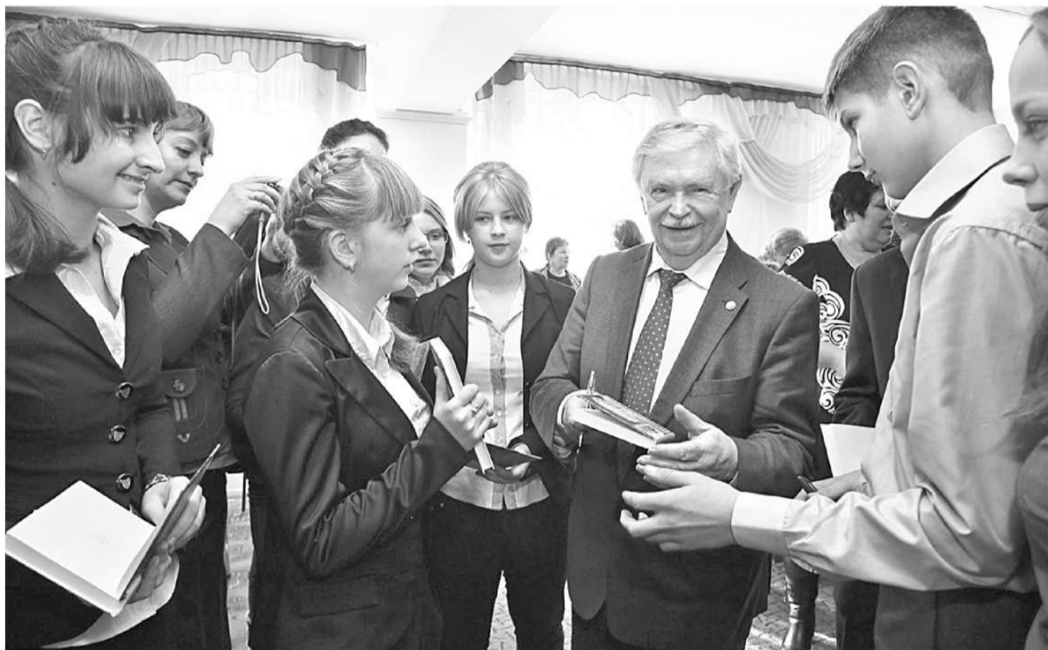
Альберт Лиханов в Грайворонской районной библиотеке

ПОЧЕМУ ЧИТАТЕЛЕЙ ПРОИЗВЕДЕНИЙ АЛЬБЕРТА ЛИХАНОВА МОЖНО НАЗВАТЬ НРАВСТВЕННЫМИ ЛЮДЬМИ